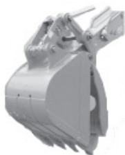
ストレンジャーバケット (グリーングラップル)

バケットのすくう機能に、フォークのつかむ機能をプラスしていますから、掘削・解体・積み込みはもとより、抜根作業などに使用します。