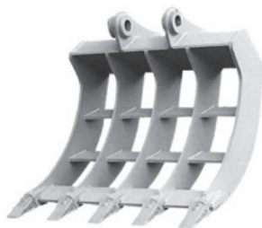
ミキシングバケット

バケットのすくう機能に、フォークのつかむ機能をプラスしていますから、掘削・解体・積み込みはもとより、抜根作業などに使用します。