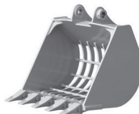
スケルトンバケット

バケットの底を格子状にして、ふるい機能をもたせています。砂利採石、鉄筋とコンクリートガラとの分離、生コンの攪拌などに使用します。